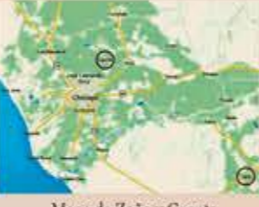
Mapa de Zaña y Capote