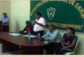
Firma del convenio con el alcalde de Zaña