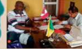
Firma del convenio con el alcalde de Picsi - Capote